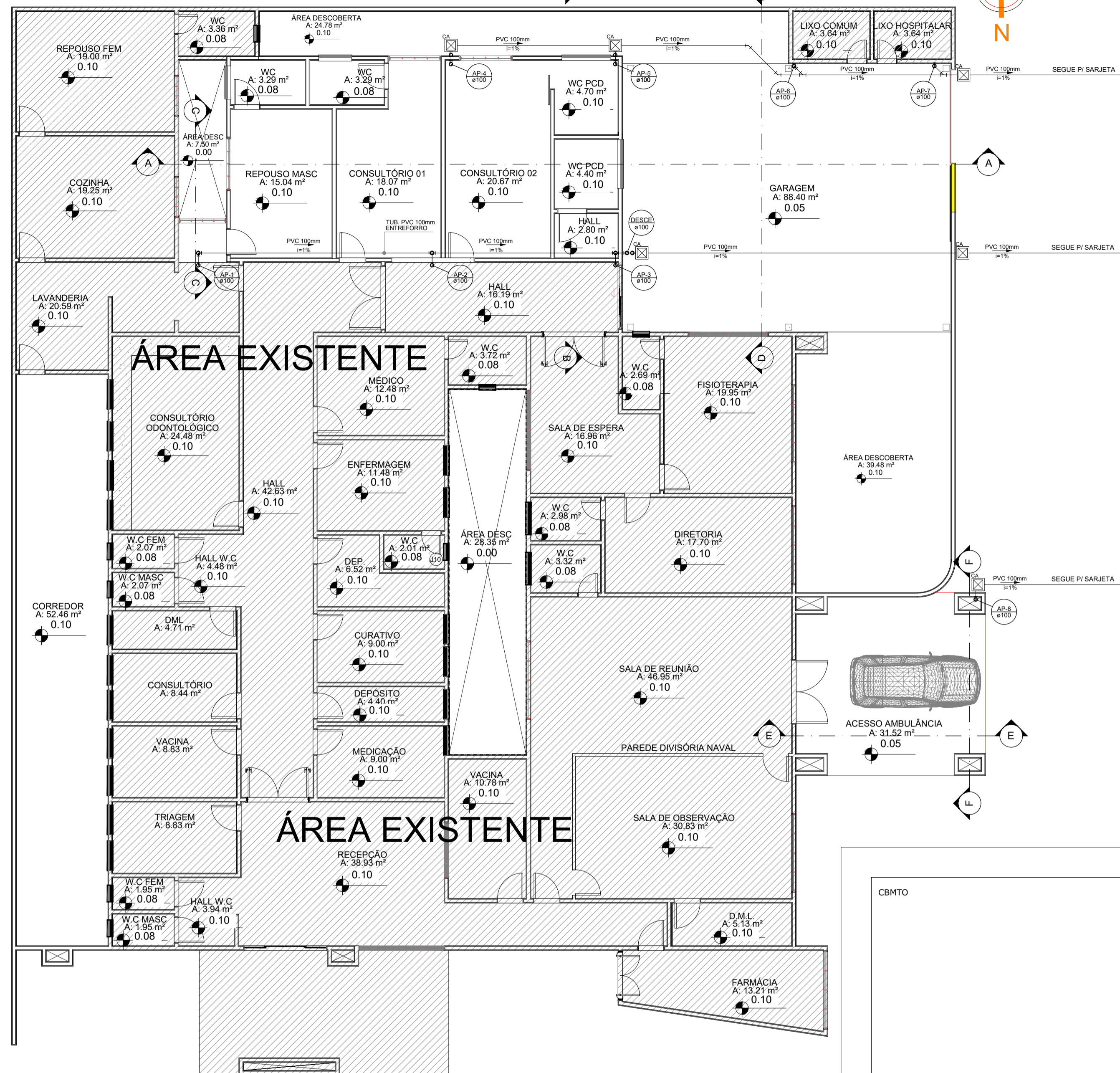
1 PLANTA BAIXA - ÁGUA PLUVIAL Esc. 1:100